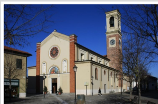
Visitazione di Maria a s. Elisabetta