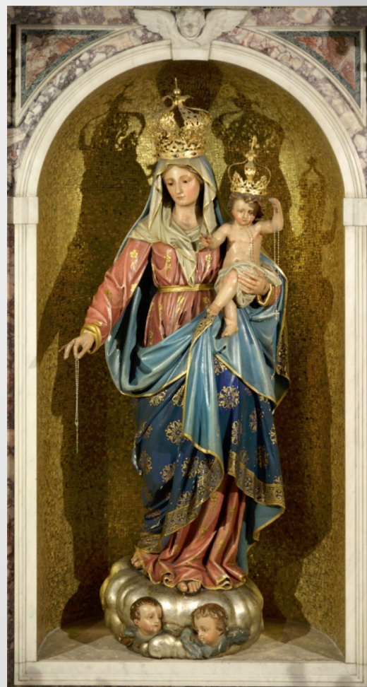
Madonna del Rosario Chiesa Ss. Gervaso e Protaso - Parabiago