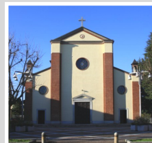
Ss. Lorenzo e Sebastiano