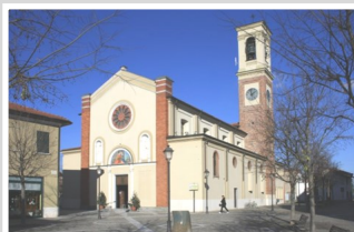
Visitazione di Maria a s. Elisabetta