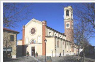
Visitazione di Maria a s. Elisabetta