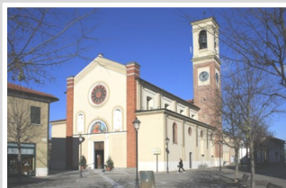
Visitazione di Maria a s. Elisabetta