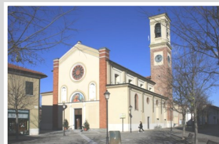
Visitazione di Maria a s. Elisabetta