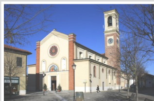
Visitazione di Maria a s. Elisabetta