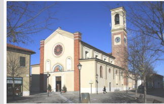
Visitazione di Maria a s. Elisabetta