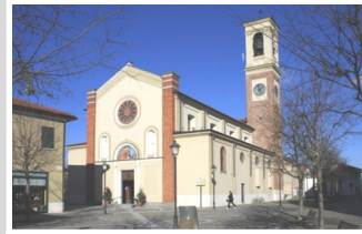
Visitazione di Maria a s. Elisabetta