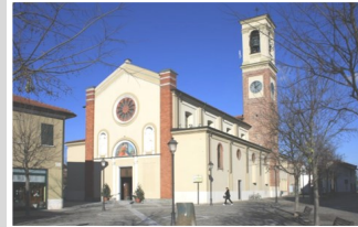
Visitazione di Maria SS. a s. Elisabetta