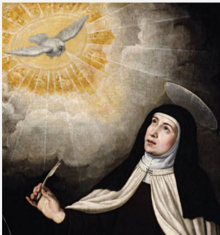
S. Teresa d'Avila

Es 40,1-16; Sal 95; Eb 8,1-2; Gv 2,13-22