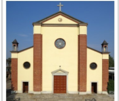
Ss. Lorenzo e Sebastiano