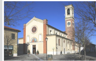
Visitazione di Maria SS. a S. Elisabetta