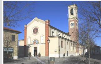
Visitazione di Maria SS. a S. Elisabetta