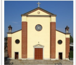
Ss. Lorenzo e Sebastiano