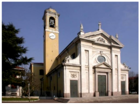
Ss. Gervaso e Protaso

Informatore della Comunità Pastorale S. Ambrogio - Parabiago Sito Internet: www.chiesadiparabiago.it Streaming Sante Messe: canale video