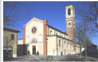
Visitazione di Maria SS. a s. Elisabetta