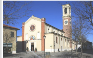
Visitazione di Maria SS. a s. Elisabetta