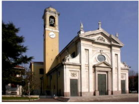
Ss. Gervaso e Protaso

Informatore della Comunità Pastorale S. Ambrogio - Parabiago Sito Internet: www.chiesadiparabiago.it Streaming Sante Messe: canale video