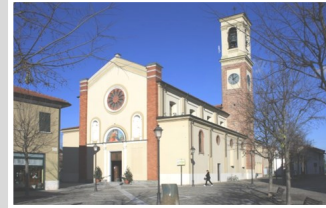
Visitazione di Maria SS. a S. Elisabetta