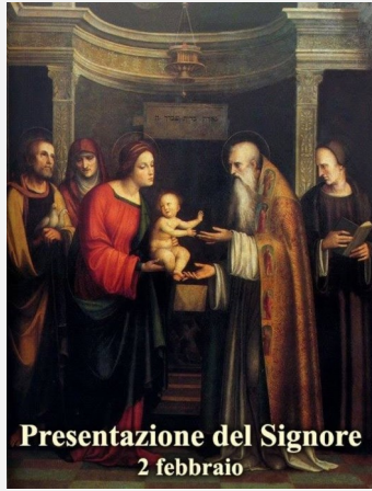
Presentazione del Signore 2 febbraio

Sir 43, 23-33a; Sal 135(136); Col 3,4-10; Mt 8, 23-27